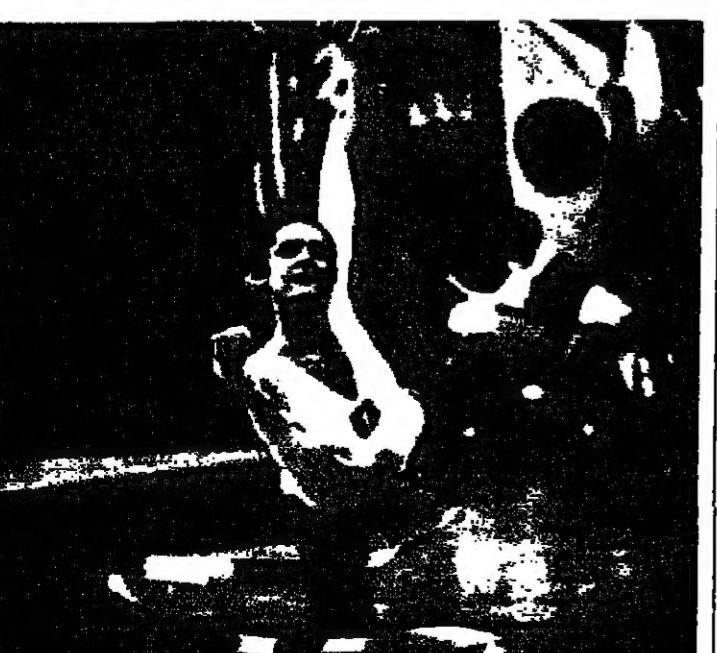
البطلة الإيطالية كريستين كاسينو تقدم عرضها بالشرائط اللوثة خلال مشاركتها ببطولة أستراليا ١٩٨٥ للامبال القوي في مدينة ميلبورن. وحلت كريستينا في المرتبة الاولى بهذه المسابقة (ب. راديو).